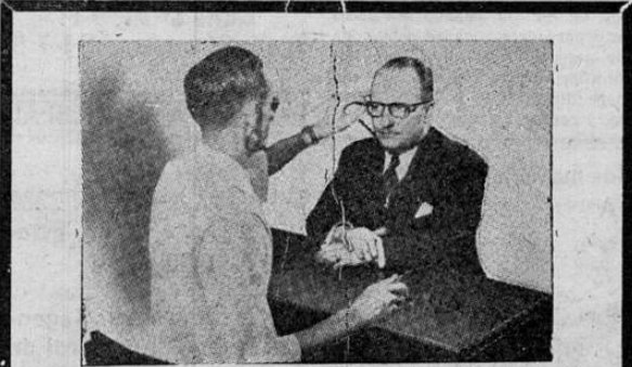
PREPARACION DE RECETAS DE OCULISTAS